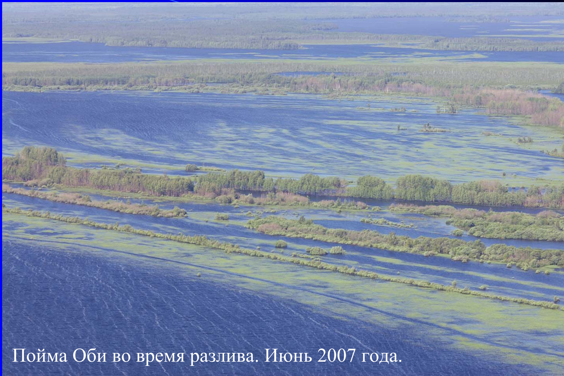
Пойма Оби во время разлива. Июнь 2007 года.