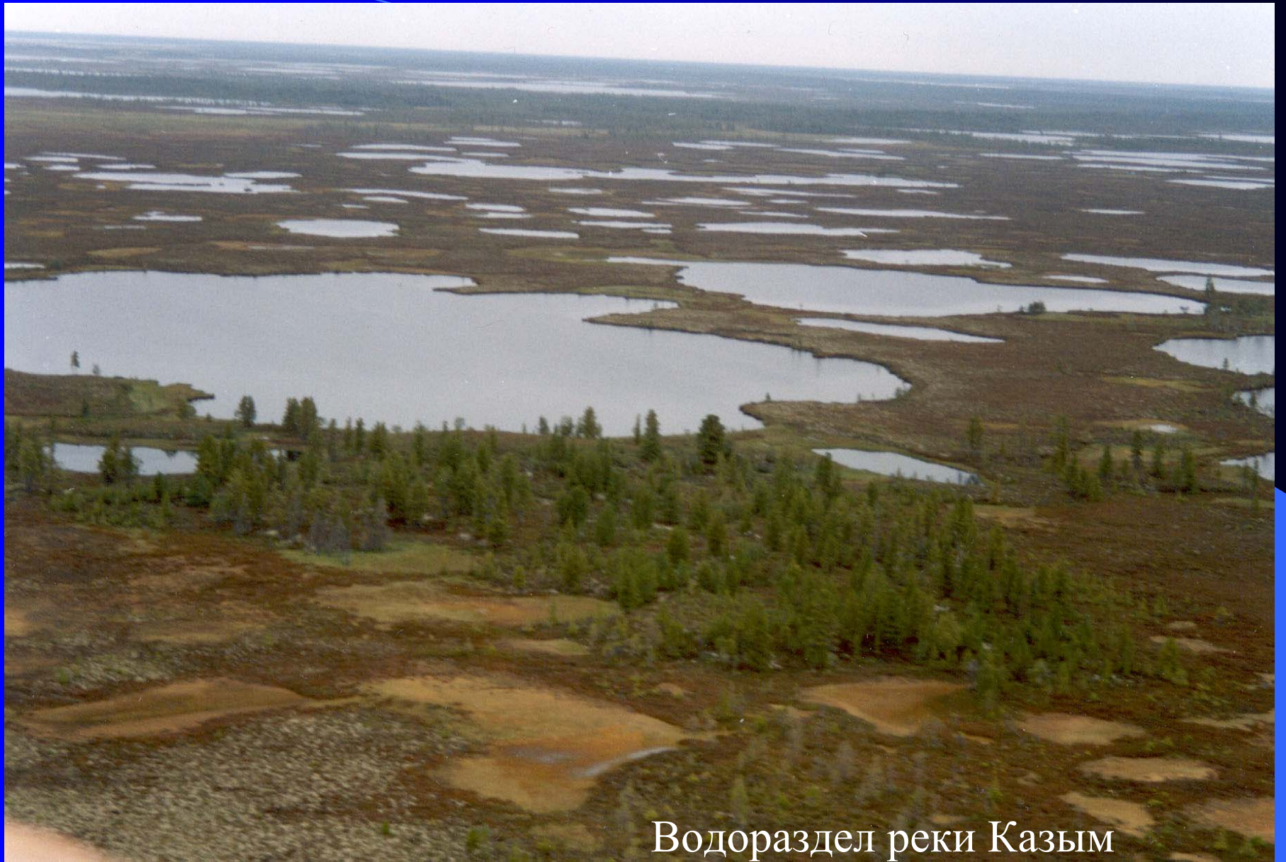
Водораздел реки Казым