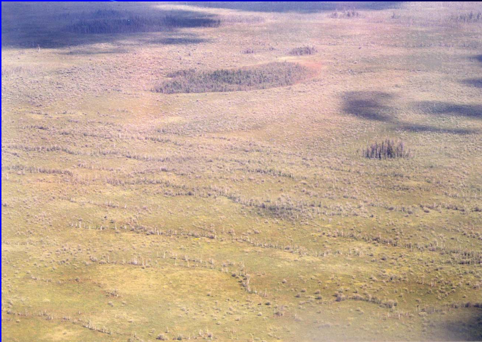
Мезотрофно-эвтрофные топи Кондо-Алымского междуречья.